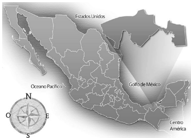
Figura 1. Ubicación geográfica del estado de Tabasco del sureste mexicano